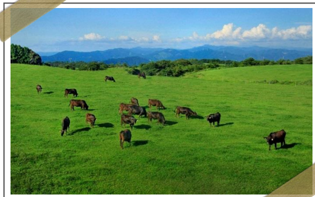
▲ 2017年優秀賞作品 「広がる牧野 ～雄大な台地で自然を楽しもう～」