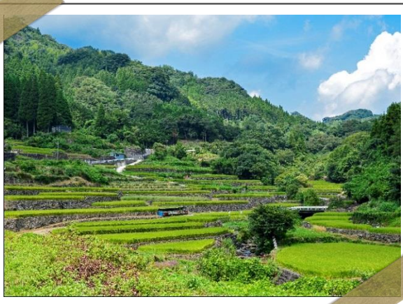
▲ 2017年入選作品 「松舟の8月」